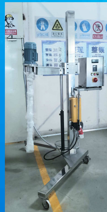
移动式液压提升机