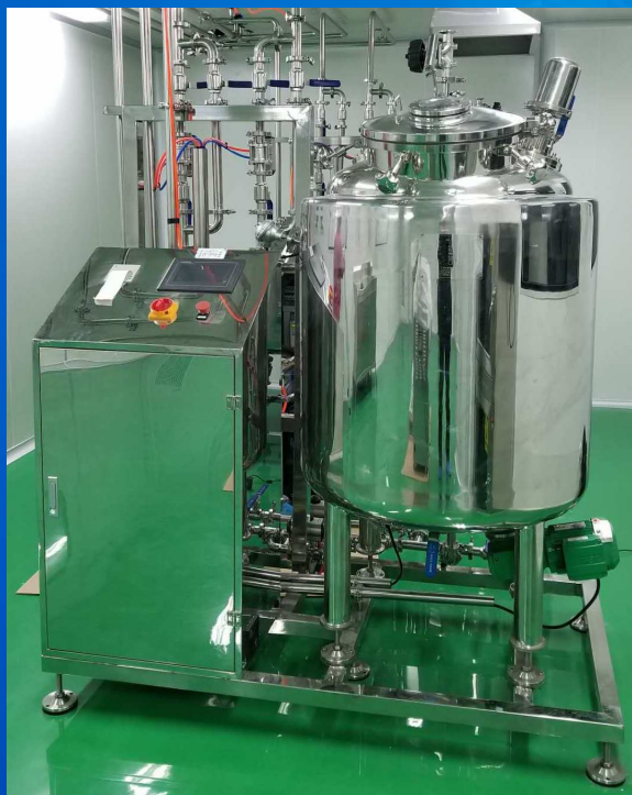
无菌法兰底部磁力搅拌配液系统