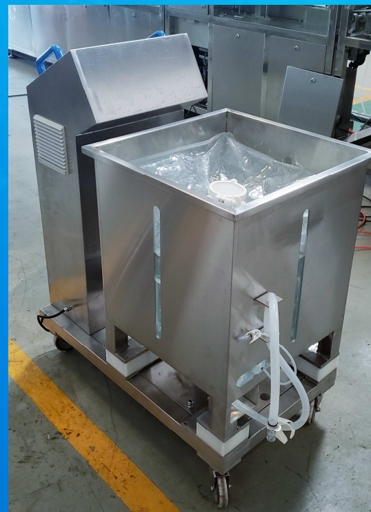
底部磁力搅拌配液系统