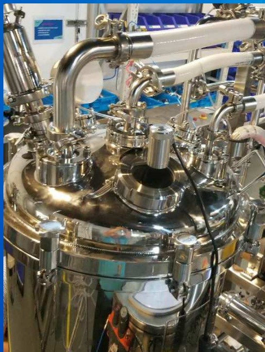
无菌法兰形式高端配液罐