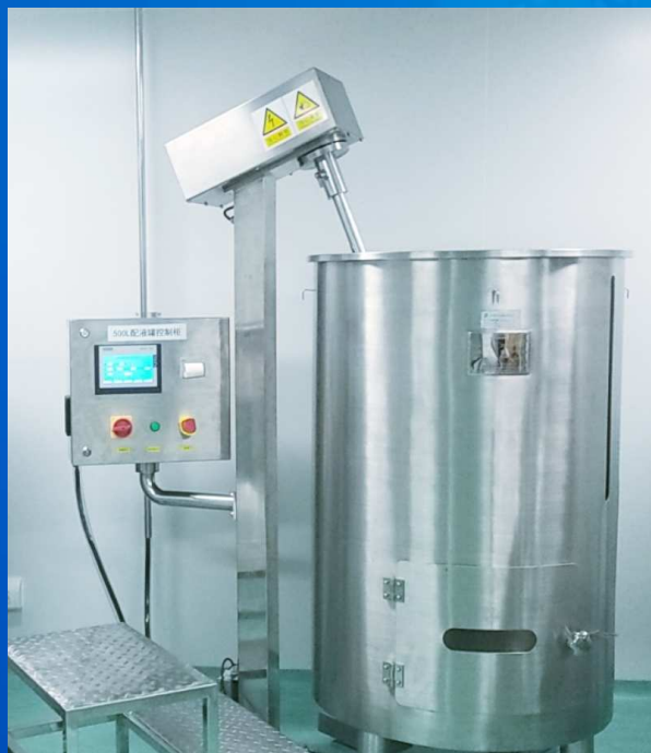
上部搅拌配液系统