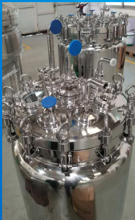
无菌法兰形式高端配液罐