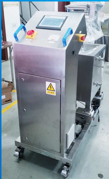
底部磁力搅拌配液系统