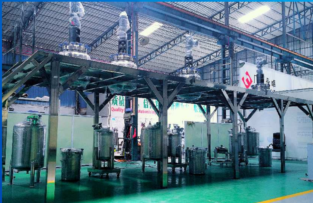
哈氏合金配液生产线