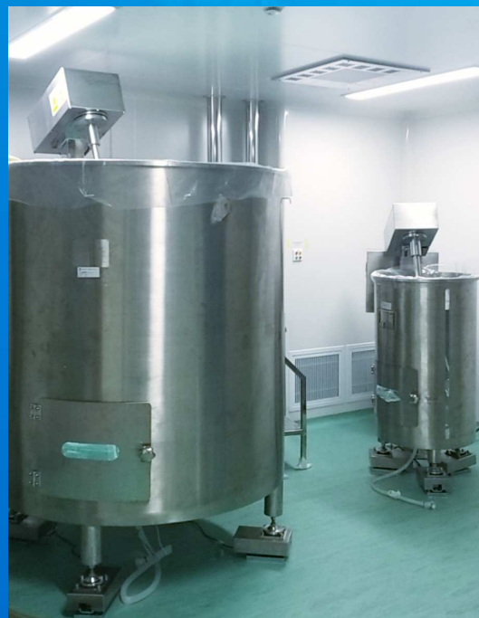
上部搅拌配液系统