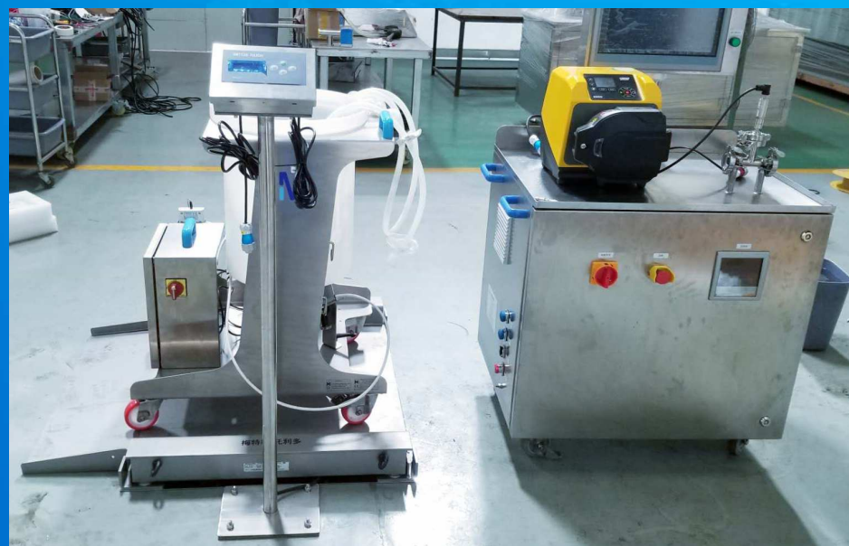
带数据收集的配液系统