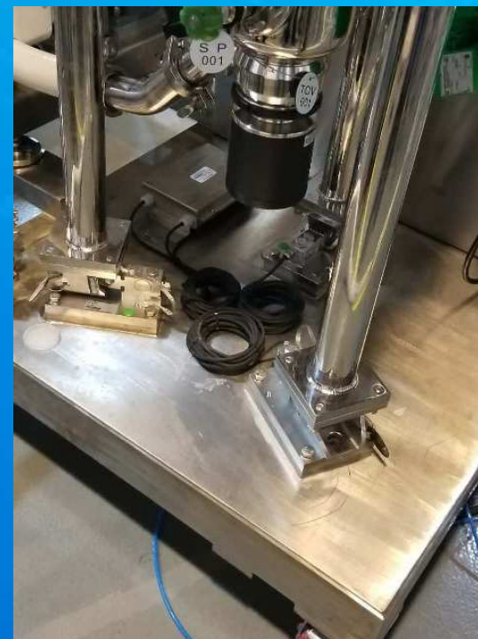
无菌法兰形式高端配液罐