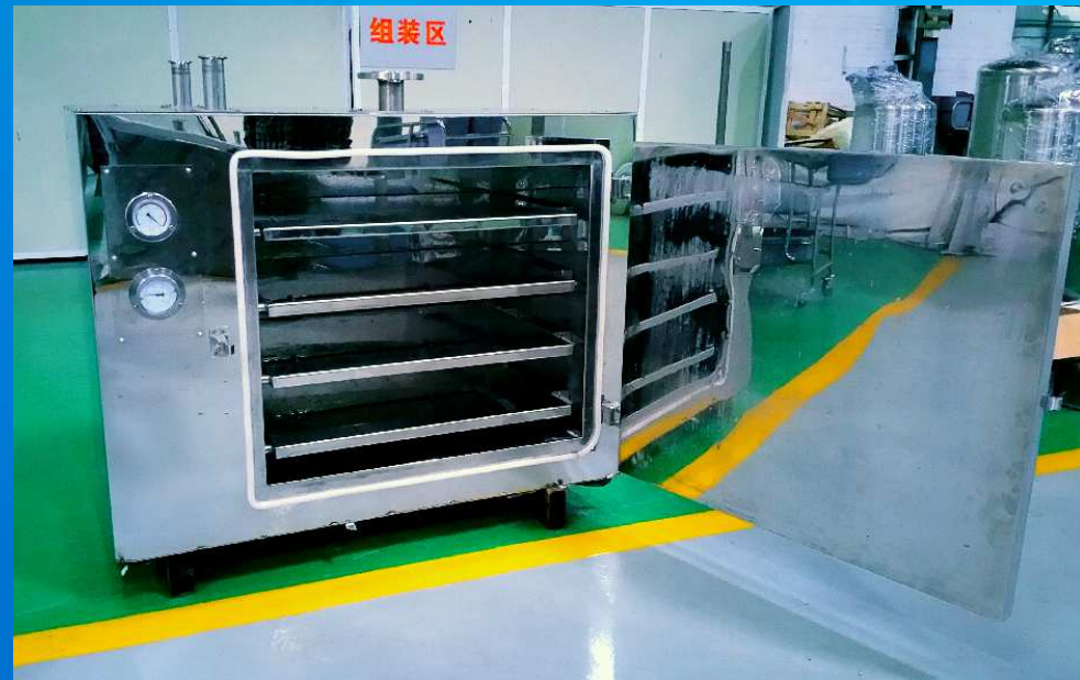
哈氏合金真空烘箱