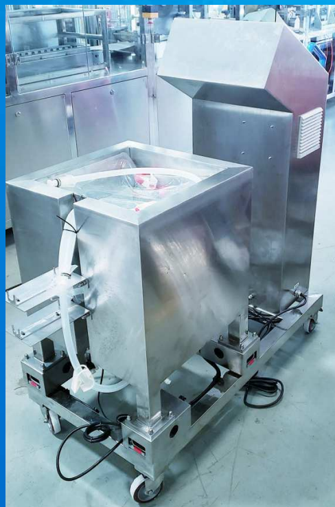
带夹套底部磁力搅拌配液系统