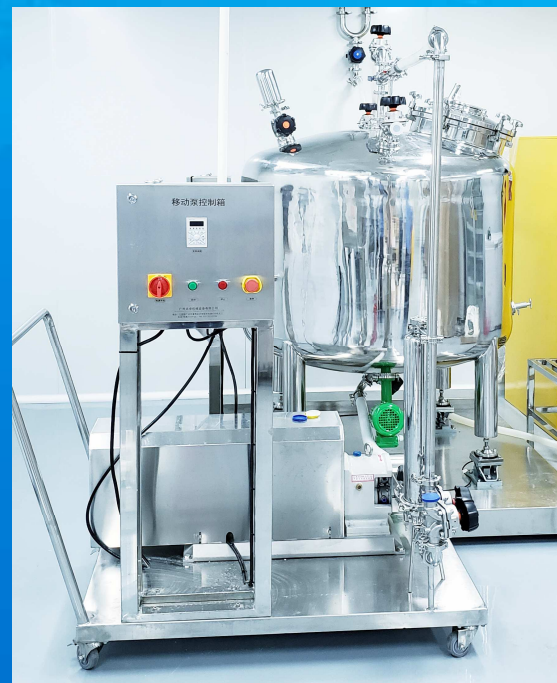
底部搅拌配液系统