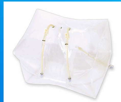
底部磁力搅拌配液系统