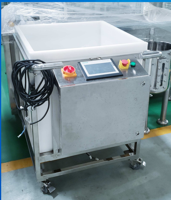
底部搅拌一次性袋配液系统